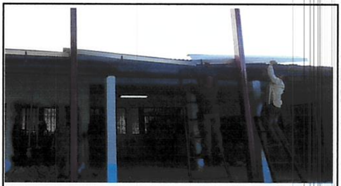
Foto 4: Sustitución de baja de agua pluvial de metal por tubo PVC "3"