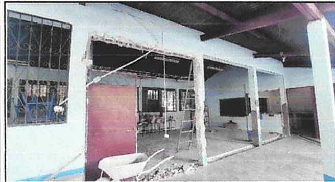
Foto 3: Cerramiento de muro para expansión de puertas y extracción de ripio