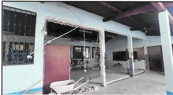
Foto 3: Cerramiento de muro para expansión de puertas y extracción de ripio