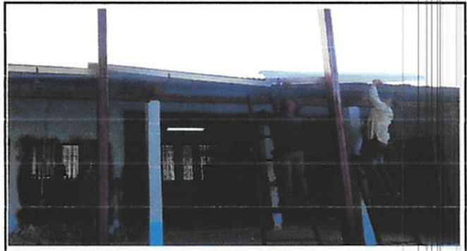
Foto 4: Sustitución de baja de agua pluvial de metal por tubo PVC "3"